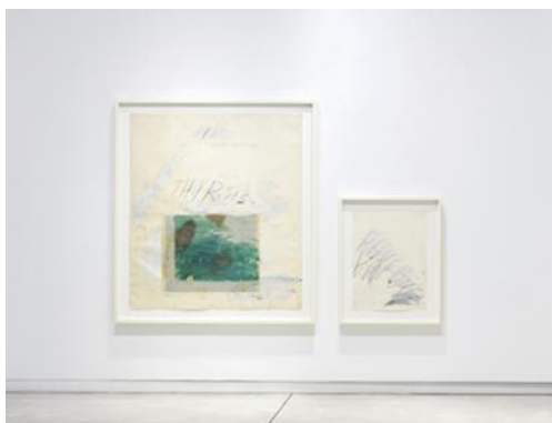
Cy Twombly, Thyrsis , 1976